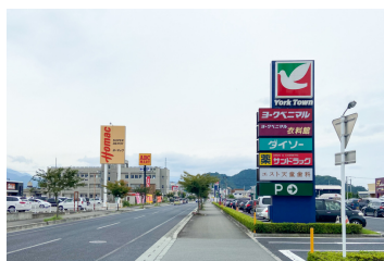
ヨークタウン天童老野森店まで230m