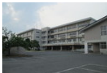
天童市立第四中学校まで1414m