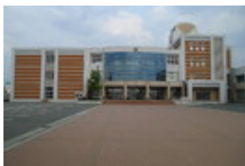
天童市立天童中部小学校まで1031m