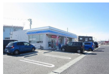
ローソン天童糠塚店まで602m